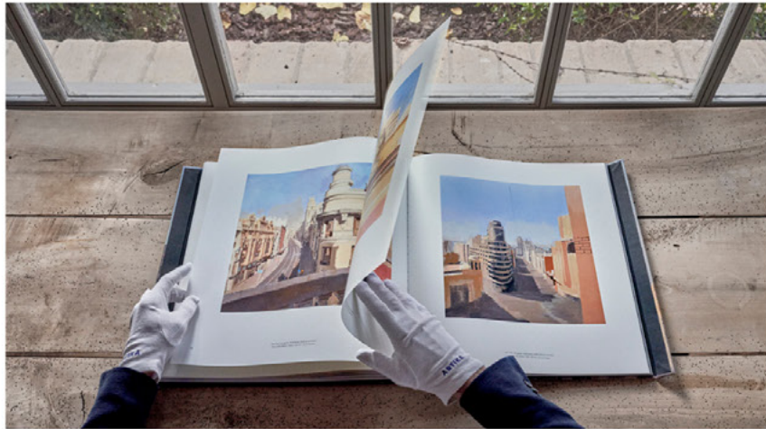
'Paisajes' es el nuevo libro de Antonio López, publicado en colaboración con ARTIKA.

López nos guía a través del proceso que le ha convertido en un referente del realismo contemporáneo: iniciado con sus primeras pinturas, creadas frente a los horizontes abiertos de su infancia, hasta las escenas urbanas que le han hecho célebre.