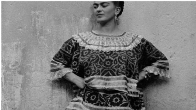
Frida Kahlo FMC VALLADOLID

Editorial Artika ha publicado Los sueños de Frida Kahlo , un libro dedicado a la pintora mexicana Frida Kahlo . La obra incluye análisis e investigaciones sobre su trayectoria y una selección de 34 obras realizadas en cuadernos, hojas de diario o en cartas enviadas a familia y amigos.