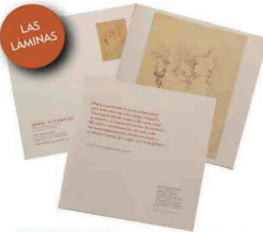
LAS MENOS VISTAS. Las litografías van pegadas a un tríptico con su título y una leyenda. En la selección se ha buscado huir de las imágenes más conocidas.