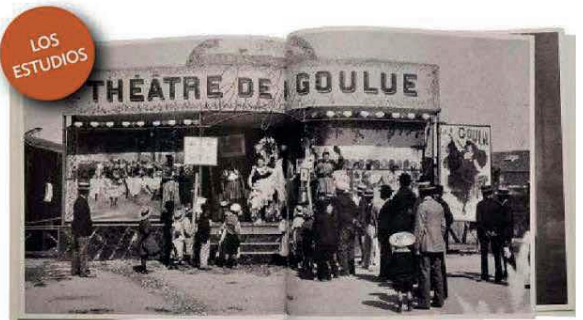
DOCUMENTACIÓN. Dos libros contextualizan el trabajo de Toulouse-Lautrec con textos de especialistas y fotografías. El primero (en la imagen) repasa la historia de Montmartre. El otro se centra en la trayectoria del pintor.

"El Teatro. Toulouse-Lautrec" está publicado por la editorial Artika. Más información: artika.es