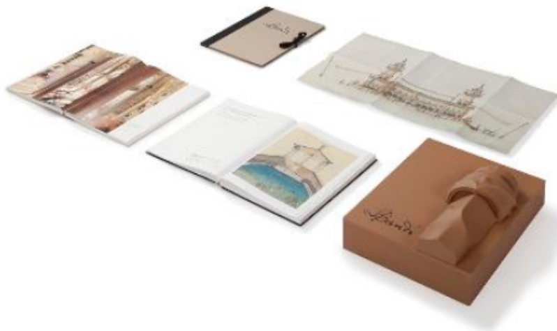
Presentación de «Gaudí en primer plano» - ABC

Tres reproducciones a tamaño real que muestran la evolución de un Gaudí que pasó de diseñar un embarcadero como parte de un proyecto universitario en 1876 a proyectar la fachada ondulada de La Pedrera y de ahí a construir ese segundo cielo de la ciudad de Barcelona que es (o será, según se mire) la Sagrada Familia. Esos tres diseños (el embarcadero «Palacio-Castillo» de 1876 que nunca se construyó pero que anticipa parte de la casa Vicens , el plano original de la fachada de la Casa Milà-La Pedrera de 1906 y un plano de la Sagrada Familia y su entorno de 1916) son la guinda de una publicación que se presenta como una suerte de renacer del legado gaudiniano.