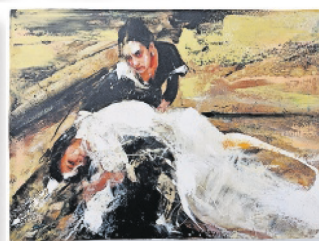
Distintas escenas del libro Bodas de sangre , obra de la artista Lita Cabellut.

La artista Lita Cabellut ilustra la gran obra de Federico García Lorca en una edición de Artika